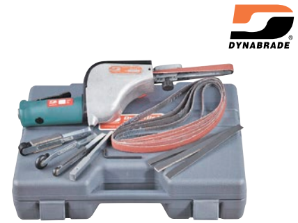
TGY726 Ensemble polyvalent

No modèle TGY725 No fab 14000 Dimensions du ruban abrasif: 1/8-1/2" la. x 24" lo. (3-13 mm x 610 mm) Débit de circulation d'air @ 90 PSI: 31 pi 3 /min Niveau du son: 77 dBA Moteur: 0,50 CV Vitesse à vide: 20 000 tr/min Pression d'air: 90 PSI Filet d'entrée d'air: 1/4 NPT Dim. du tuyau (D.I.): 3/8" (10 mm) Pi.ca/min max.: 5800 pi.ca/min Longueur: 14 3/5" (371 mm) Hauteur: 4" (102 mm) Poids: 3,1 lb (1,41 kg) Prix/Chacun: $