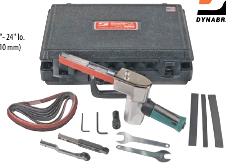
TGY738 Ensemble polyvalent

No modèle: TGY737 No fab 40320 Dimensions du ruban abrasif: 1/4" - 3/4" la. x 18" - 24" lo. (6-19 mm x 457-610 mm) Débit de circulation d'air @ 90 PSI: 28 pi 3 /min Niveau du son: 80 dBA Moteur: 0,50 CV Vitesse à vide: 20 000 tr/min Pression d'air: 90 PSI Filet d'entrée d'air: 1/4 NPT Dim. du tuyau (D.I.): 3/8" (10 mm) Pi.ca/min max.: 4550 pi.ca/min Longueur: 14 1/4" (362 mm) Hauteur: 4 7/8" (124 mm) Poids: 2,5 lb (1,14 kg) Prix/Chacun: $