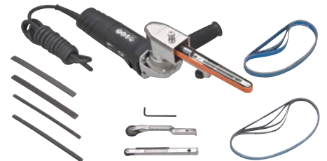
TGY745 Ensemble polyvalent

No modèle TGY744 No fab 40610 Dimensions du ruban abrasif: 1/4" - 3/4" la. x 18" - 24" lo. (6-19 mm x 457-610 mm) Tr/min Max.: 11 000 tr/min Pi.ca/min max.: 2520 pi.ca/min Longueur: 19" (445 mm) Hauteur: 5 1/2" (121 mm) Poids: 5 lb (2,1 kg) Prix/Chacun: $